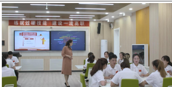
图 5 课堂讨论