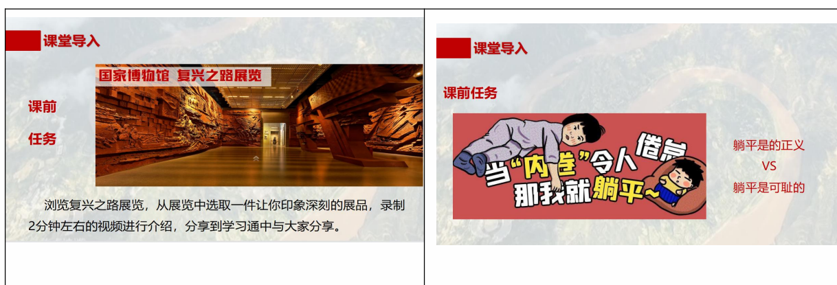
图3 多模型课堂导入

课堂导入是教学的起始环节，虽然所占比例小，但却是整个教学活动成功的基石，成功的课堂导入是激活学生学习兴趣的关键。